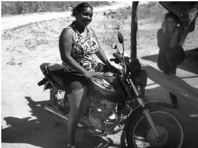
Figura 3: Trabalhadora Rural Migrante em Jaicós/PI e sua motocicleta.