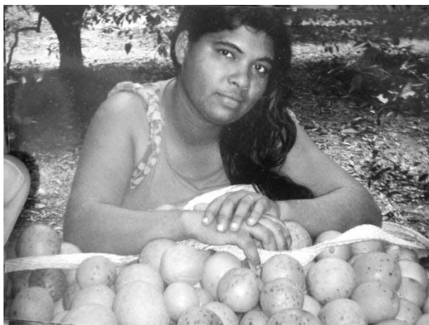
Figura 1: Reprodução de imagem do acervo pessoal de uma Trabalhadora Rural Migrante ilustrando a colheita da laranja na Safra de 2013 no município de Matão/SP.