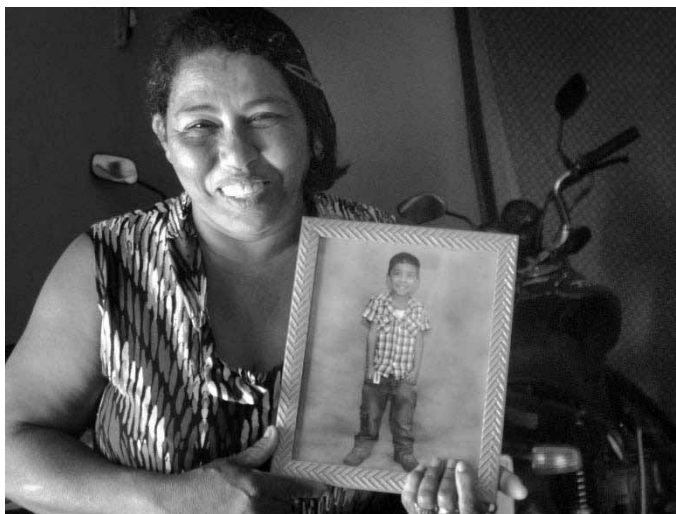
Figura 4: Avó, em sua casa em Jaicós/PI, nos mostra foto do neto residente temporariamente em Matão/SP.