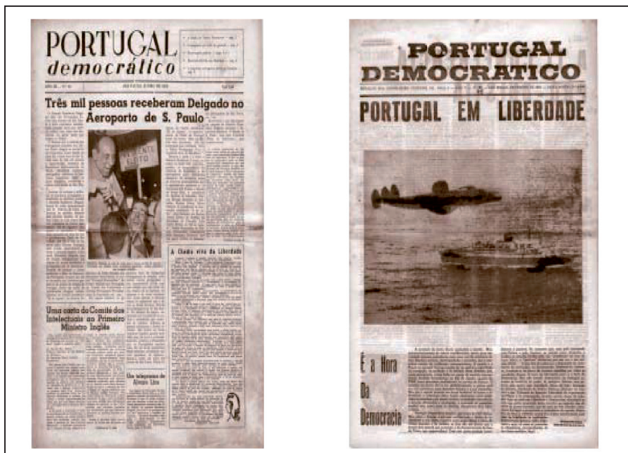
Capas do jornal Portugal Democrático.