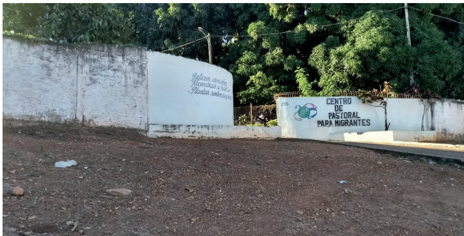
Foto 1 - Centro de Pastoral para o Migrante (CPM), Cuiabá (2022).