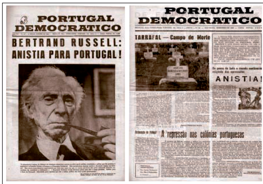
Capas do jornal Portugal Democrático.