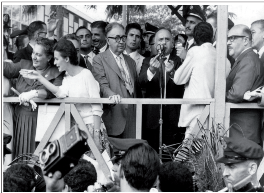
Palanque no Ibirapuera no dia da posse de Prestes Maia como prefeito, com Maria Prestes Maia à esquerda.