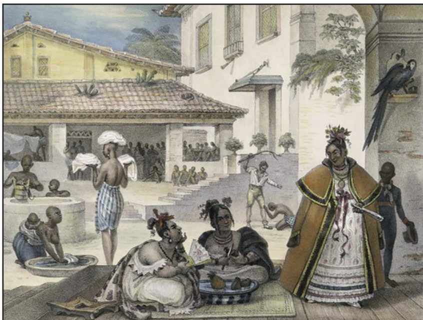
Figura 1 : Intérieur d'une habitation de cigannos ou Interior de casa de ciganos de Jean- Baptiste Debret (1835). A obra retrata a relação entre ciganos e negros escravizados no Brasil colonial.

escreveu o francês em Viagem Pitoresca e Histórica ao Brasil , publicado em Paris em 1835. Fez-me refletir: A quem interessava aqui e na Europa retratar a imagem aristocrática de mulheres ciganas brasileiras que viviam à margem desta sociedade que a obra tenta as igualar?